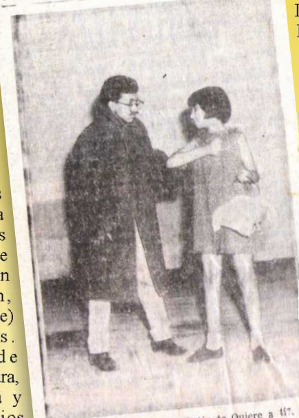
UNA ESCENA de la obra "¿Quién te quiere a tí?" presentada en San Pedro de las Colonias. Los jóvenes actores dieron con buen éxito su primer paso.