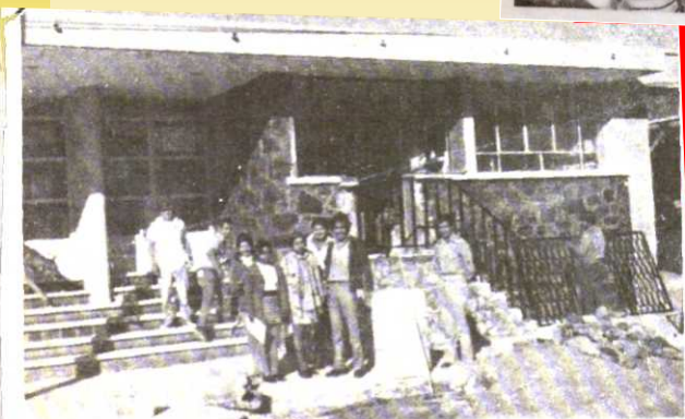
PERSONAL QUE LABORA en el Departamento de Extensión Cultural de San Pedro, Coahuila, y que llenó sus oficinas en el Auditorio Municipal. Esta dependencia fue creada por ordenes del alcalde municipal, Francisco Guerrero Galindo, y viene a llenar una necesidad de esta población.