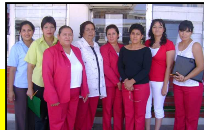
Personal Administrativo del Conalep

paquetes para el total de los alumnos del conalep, dichos paquetes contienen: cartapacio, 200 hojas, 3 cd's, juego de geometría, diccionario Larousse, 2 marcadores, 2 plumas, 2 lapices y una carta del gobernador