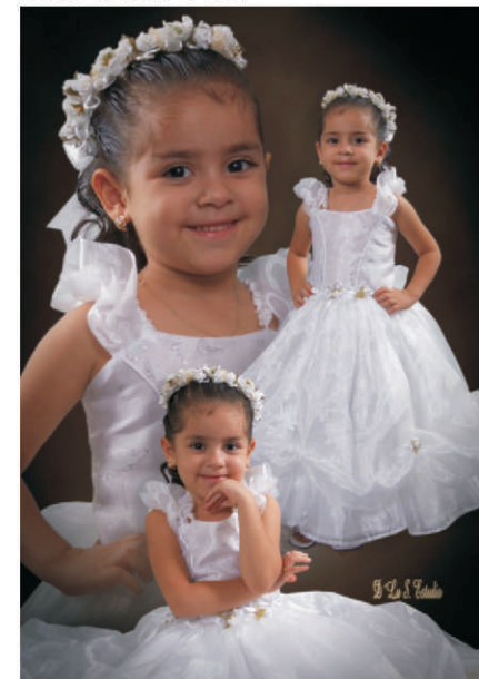
3 años de Azalea