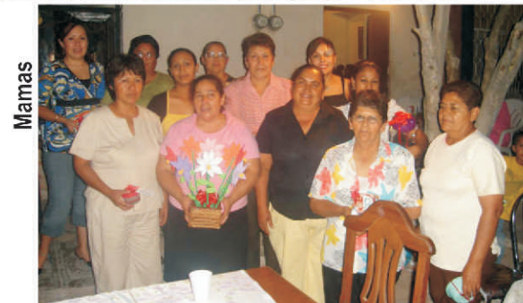
Festejo de las vecinas de la calle M. Acuña el día de las madres.