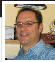
Por Ricardo Pérez

En estos días de fiestas deseo, a quien esto lee, mucha alegría al lado de buen pan y mejor gente.