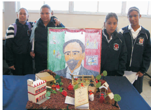
Algunos de los asistentes en la pasada inauguración de la cancha de futbol " Centenario de la Sucesión Presidencial"