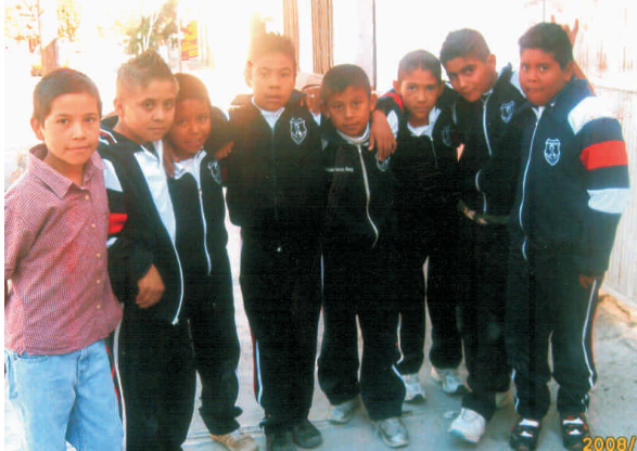
Equipo de Piramides de la Escuela Primaria Manuel Acuña.